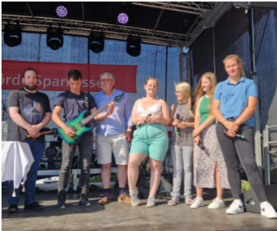
JUGENDBAND beim Stadtbuchfest

Gleich dreimal trat die Jugendband auf: zu ihrem Konzert im Gemeinde-saal und in zwei Gottesdiensten: zur Konfirmation und auf der großen Bühne des Stadtbuchfestes.